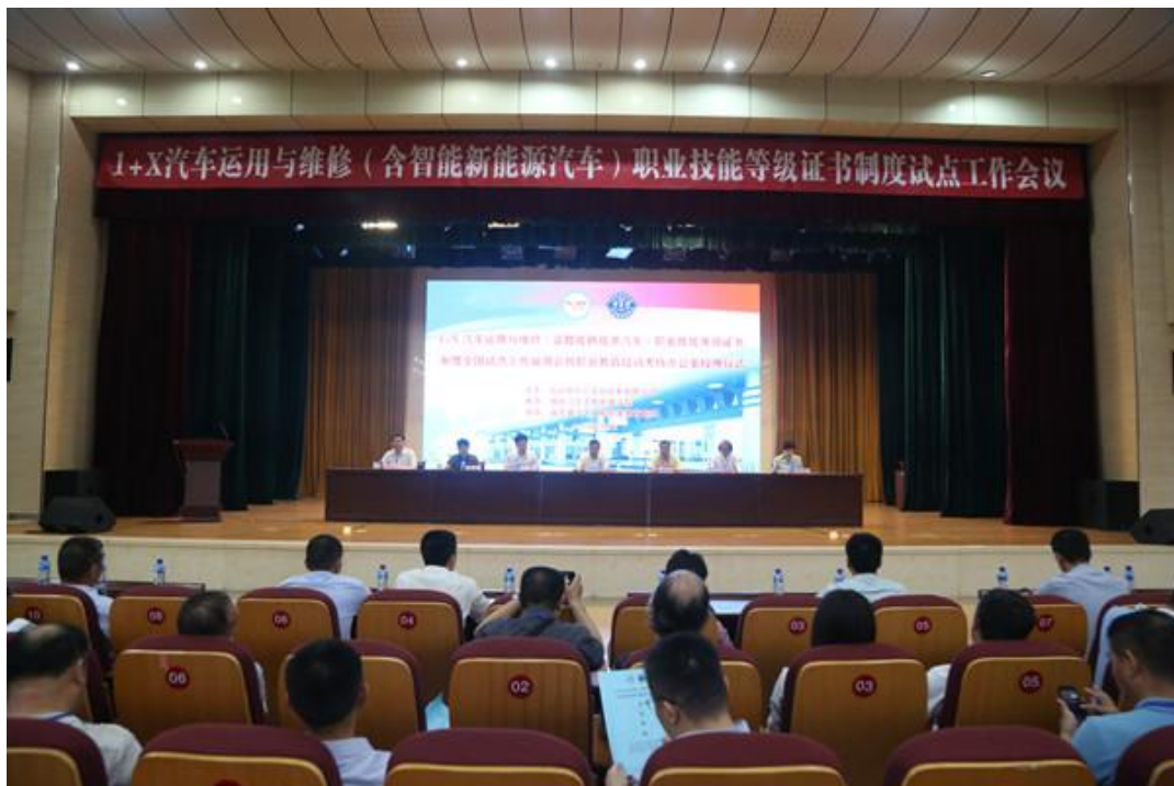
学院举行1+X汽车运用与维修(含智能新能源汽车)职业技能等级证书制度试点工作说明会暨职业教育培训考核办公室授牌仪式