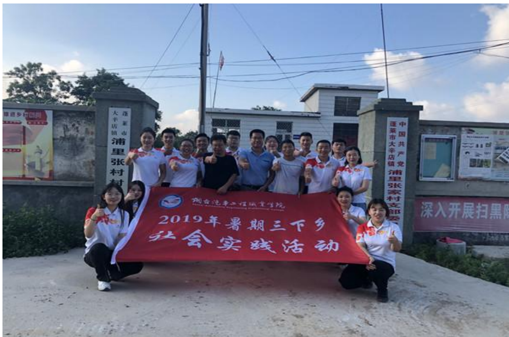
社会实践服务队合影