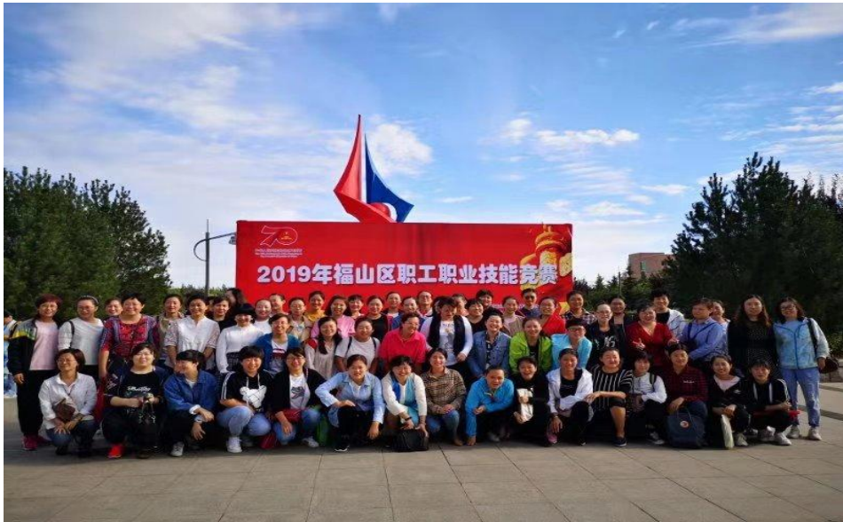
育婴员参赛选手合影照片

山区职业技能竞赛活动组委会领导们的高度肯定。福山区电视台对本次竞赛也进行了报道。