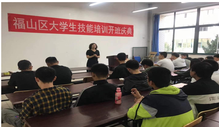
第二期大学生面点培训开班开班照片

此培训项目是人力资源与社会保障部门免费向高校大学生开展的培训，免费提供培训教材与实训耗材。每期培训结束后，免费统一组织学员参加职业技能鉴定考试，成绩合格者颁发人力资源与社会保障部门的面点师五级职业资格证书。