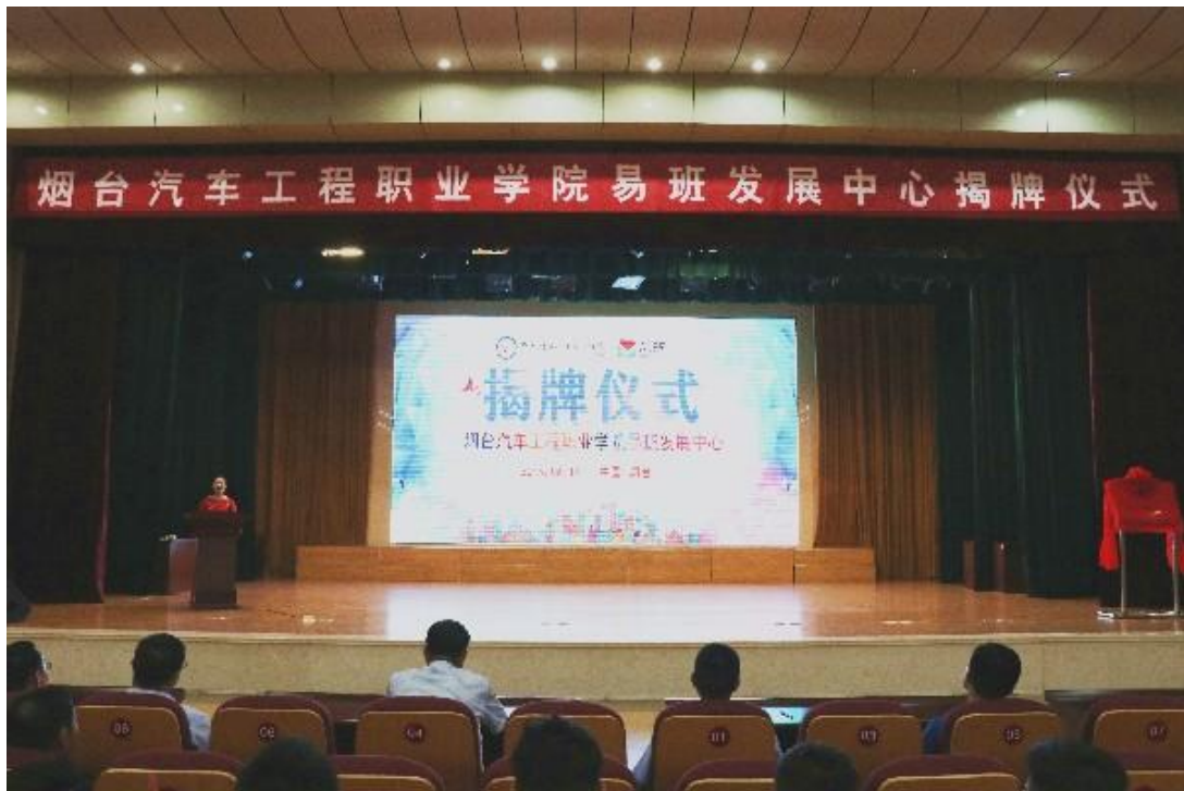
学院隆重举行易班发展中心揭牌仪式

欢看、离不开的网络新媒体平台，助力学院育人水平的提升，更高质量地推动学院省级优质校建设。