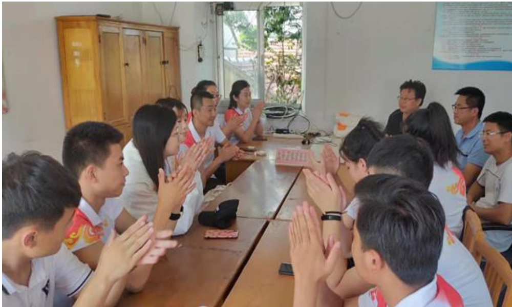
学院社会实践服务队了解村民基本情况

本次社会实践活动虽然短暂，但是队员们却收获颇丰。队员们不顾天气的炎热，不辞辛劳，服务队深入基层，了解了百姓的疾苦，把党和政府的关怀送到贫困户的家中，展现了新时期大学生乐于奉献的精神风貌和责任担当。队员们纷纷表示，在今后的学习和生活之中，要不断提高自己的综合素质，为新农村建设，为实现中华民族伟大复兴的中国梦，贡献自己的智慧和力量。